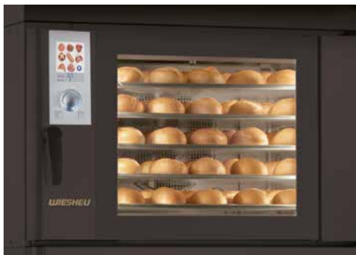
Дизайн в стиле ретро