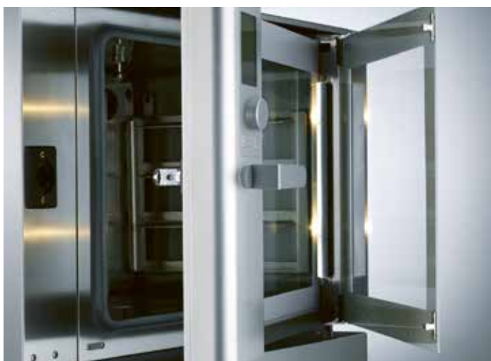
Откидное смотровое окно