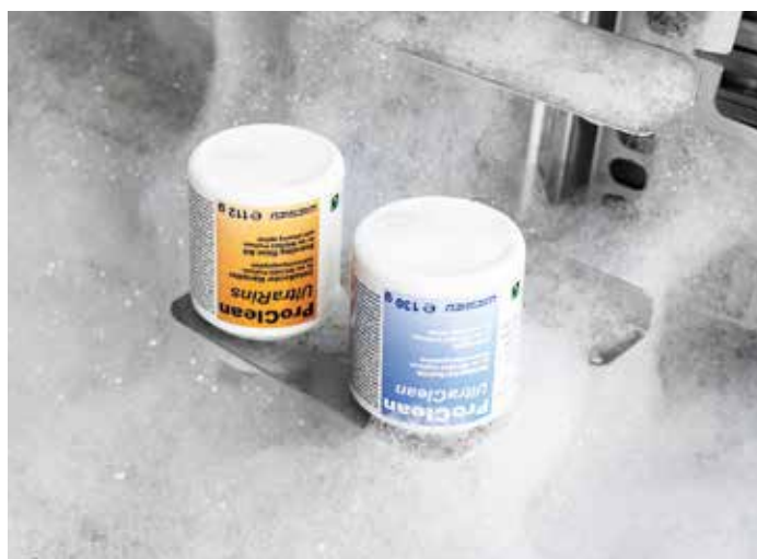
Автоматическая система очистки ProClean